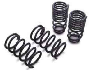
[ローダウンスプリング] SAE9254材を使用。ストリートからワイン ディングまでローダウンと乗り心地を両立。