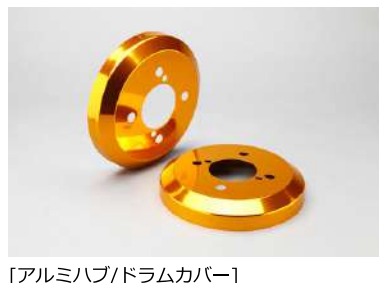
[アルミハブ/ドラムカバー] 加工無ボン付け可能なアルミカバー。足元に アクセントを加えます。シルバー/レッド/ ゴールド/ブルーの四色設定。