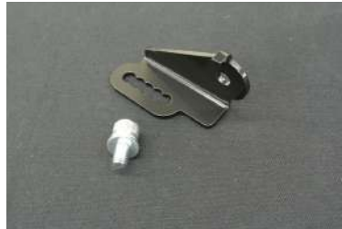
[オートレベライザーセンサーステー] 車高変更等により狂ってしまう光軸を センサー取付位置を変更することにより 補正が可能です。