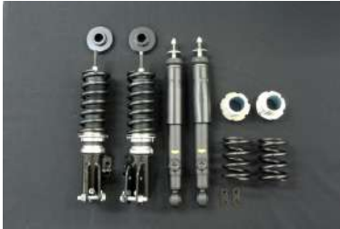
[サスペンションキット RMS-K] 前後調整式/減衰F12R14段調整式。 ストリートからミニサーキットまで幅広い カテゴリーをターゲットにしたサスペン ションキット。

2014年12月22日にアルトの8代目モデルとして発売開始。「原点回帰」という考えのもと初代アルトのコンセプトが強く意識されている。610kg〜という軽い車重や市販車トップの37.0km/Lという燃費数値の達成。またかつてのアルトのようなシンプルさを目標に開発された。2015年3月11日にターボエンジンモデル搭載の「ターボRS」発売。同年12月24日に「ワークス」公式発表、発売開始。約15年ぶりに「ワークス」が復活した。