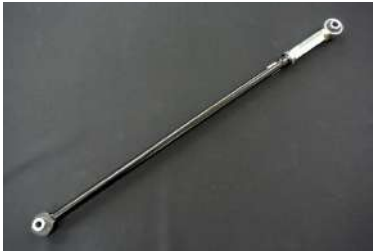
[ラテラルロッド調整式] 車高変更によりずれてしまうアクスルの 左右のズレを補正可能です。ターンバック ル調整、強化ゴムブッシュ仕様。