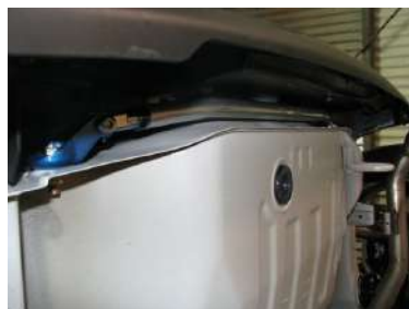
[モノコックバー リア バンパー内] KAWAI WORKS製品。 左右フレームを繋ぎます。