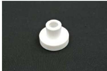
[クラッチワイヤーブッシュ] 純正のゴムブッシュと交換すること により、遊びを無くしダイレクトなクラッチ フィーリングに改善します。