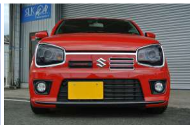
[ヘッドライトカバー] 付属両面テープで貼付けるだけの簡単装着。 エクステリアにアクセントを加えるだけでな くライトの保護にも役立ちます。ダークスモ ーク/ライトスモーク/イエローの三色設定。