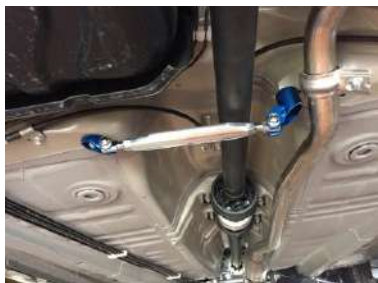
[モノコックバー センターB(4WD)] KAWAI WORKS製品。 左右フレームを繋ぎます。純正交換。