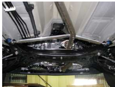
[モノコックバー フロント] KAWAI WORKS製品。 左右フレームを繋ぎます。