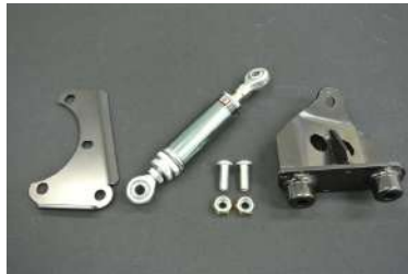
[エンジントルクダンパー] エンジンとボディをオリジナルダンパーで 連結し、効果的にエンジンの振動を抑制 します。