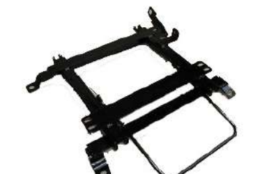
[純正レカロ用ローポジションレール] 純正レカロシートをローポジションさせる ことができます。30mmダウンタイプと 70mmダウンタイプ設定あります。