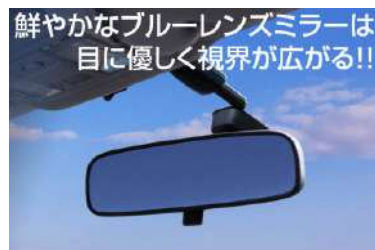
[ブルーレンズルームミラー] マルチ多層コーティングにより夜間走行時の 後続車から発せられる眩しい光を軽減。バック ライトの50〜60%吸収。IR光(赤外線) の99%吸収。UV光(紫外線)の99%吸収。