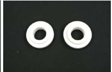
[アクスルリジッドカラー] アクスルブッシュに挟み込むこと によりブッシュの変形を抑制します。