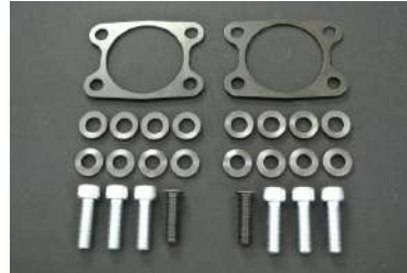
[リアキャンバーキット] リアキャンバー角を約-3.0度、トーを約0mm にセッティング可能。車高値-30〜-50mm の車両用。(競技専用部品)