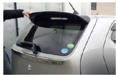
[ウィングエクステンション] 純正ウィングに被せるだけの簡単装着。 ABS製。