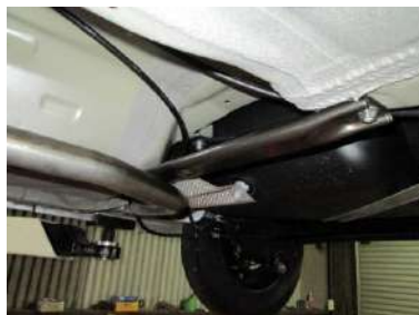
[モノコックバー センターB(2WD)] KAWAI WORKS製品。 左右フレームを繋ぎます。純正交換。