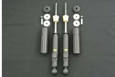
[リアショートダンパー14段KYB製] ストリートからサーキットまで対応するセ ッティング幅。減衰14段調整。KYB製造。