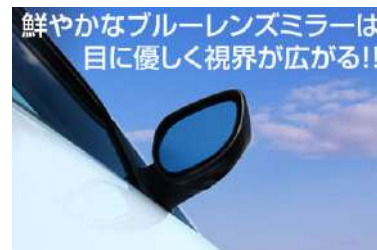
[ブルーレンズドアミラー] マルチ多層コーティングにより夜間走行時の 後続車から発せられる眩しい光を軽減。バック ライトの50~60%吸収。IR光(赤外線) の99%吸収。UV光(紫外線)の99%吸収。