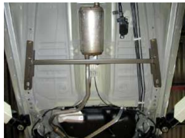
[モノコックバー センターA] KAWAI WORKS製品。 左右フレームを繋ぎます。