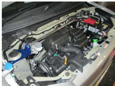
[ストラットタワーバー フロント] KAWAI WORKS製品。 左右ストラットマウントを繋ぎます。 NA専用