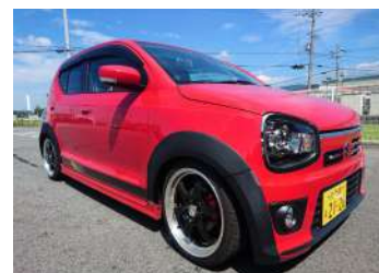
[フェンダーエクステンション] ワイドフェンダーキット。最大18mmワイド になります。ABS製。