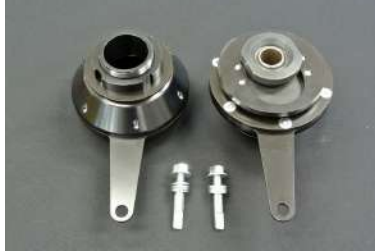
[センターロックピロアッパーマウント] 純正ゴムマウントと交換することにより、 キャンバー調整可能になります。