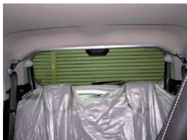
[ピラーバー スクエア] KAWAI WORKS製品。 室内左右ボディを繋ぎます。