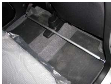
[フロアバー] KAWAI WORKS製品。 室内左右フレームを繋ぎます。