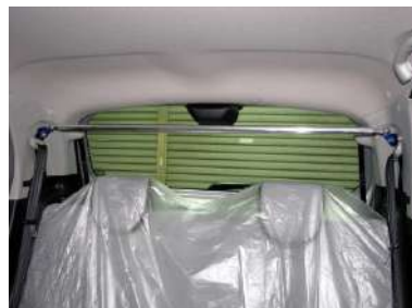
[ピラーバー ストレート] KAWAI WORKS製品。 室内左右ボディを繋ぎます。