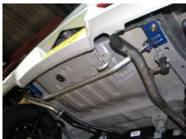
[モノコックバー リア] KAWAI WORKS製品。 左右フレームを繋ぎます。