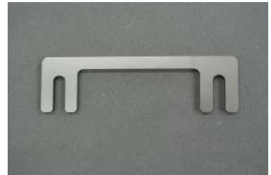
[ステアリングローポジションスペーサー] ステアリングの位置を純正比約20mm下 げることが可能です。