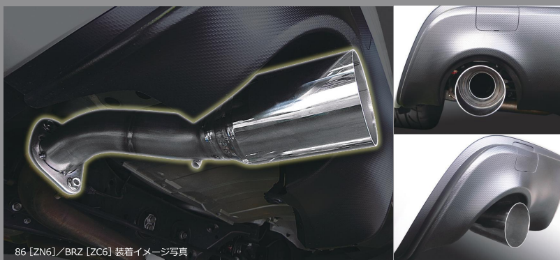
86 [ZN6]/BRZ [ZC6] 装着イメージ写真